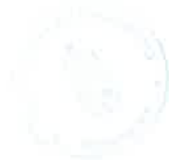
Filep Sándor polgármester